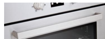
Griff Vero Modell BO.01